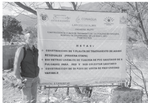
地方自治体に設置された小規模プラント施工掲示と筆者

なり時間を要するのではと懸念していたが、この10年間で下水道施設の普及は目を見張るものがある。10年間前には数10カ所であった下水道処理施設は、現在では1,800ヶ所にまで達しており、様々な処理方式を採用していた。一説によると数年前の蔓延したインフルエンザの影響もあるとのこと耳にするが、水環境に対する国の意識は大きく変化している。欧米諸国、スペイン等の経済援助が見られるが、日本の大手商社による下水道事業の支援も大規模な形で進んでいる。