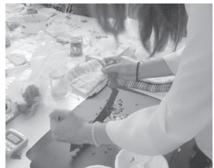
特殊な包丁でモロヘイヤ（野菜）を刻む学生