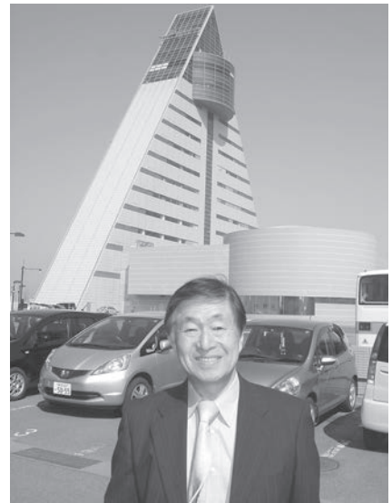
青森県物産振興協会事務所が入っている青森県観光物産館（アスパム）を背に

赴任して3ヵ月後からは課題のカタログの作成・英訳を纏めに掛かると共に販路開拓に待望の海外に出掛けて行った。最初がシンガポールだった。出張した先で、自然に伊藤忠時代に教えられ、実績を挙げてきた、「商売の可能性があると見込んだ相