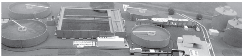
日本の大手商社によってケタラ州に設置された下水道施設 (全体模型)