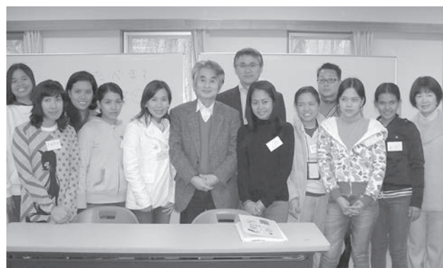
国立那須甲子青少年自然の家（白河）で 最後の授業後、教室で記念撮影

中国、フィリピン、ベトナム等の国々から技能実習生を受け入れているエコロジー促進事業協同組合（以下、協同組合）さんからABICが彼等に対する外部日本語教師の委託を受け、その一人としてフィリピンからの技能実習生相手に日本語を教える機会に恵まれた。3月の那須（白河）