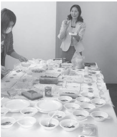
テーブルに並べられた試食用の料理の数々

25名の学生たちはテーブルを囲んで立ち、ラマダーン（断食月）のクイズに答えながら預言者ムハンマドに倣ってまずはデーツを口にし、そして試食会。その間、食前食後の祈りの言葉、食事のマナー、古来の伝統的な食事風景と現代との違い、などを紹介。女性は家族や親戚など親しい間柄でなければ、公の場では男性と分かれて居る慣習となっていることや、女性たちがヘジャーブ（ベ