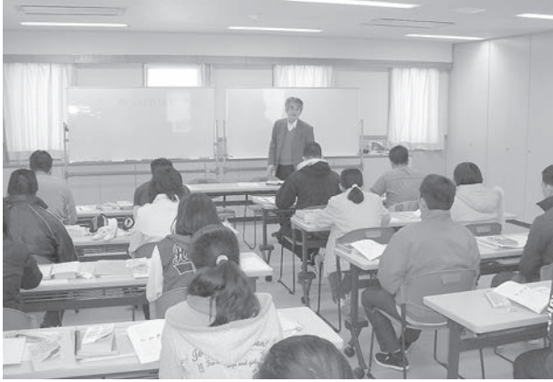
国立那須甲子青少年自然の家（白河）での授業 (2012年3月)

っていた私は2006年に開講されたABICの「日本語教師養成講座」を迷わず受講した。会社人生活を卒業後もこのような国際的な取り組みに関わることが出来るのも協同組合さんとABICのお蔭であり恵まれた人生である。この様に彼等が育った、そしてアセアン諸国の中で未だ訪問したことのないフィリピンを是非早い機会に見てみたいと思う。