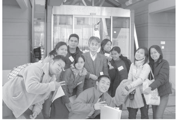
最後の授業後、教室への入り口で実習生と

っていた私は2006年に開講されたABICの「日本語教師養成講座」を迷わず受講した。会社人生活を卒業後もこのような国際的な取り組みに関わることが出来るのも協同組合さんとABICのお蔭であり恵まれた人生である。この様に彼等が育った、そしてアセアン諸国の中で未だ訪問したことのないフィリピンを是非早い機会に見てみたいと思う。