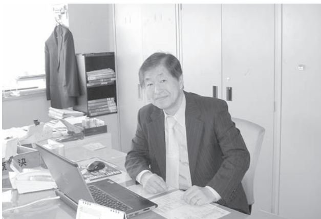
青森県物産振興協会事務所に

赴任後、本格的に食品を学ぶにつれ分ってきたのが、食品は繊維原料と似て、IT関連・機械類のような技術的な専門家である必要が少ないということであった。両業界の基本的な違いは、食品には賞味期限、繊維原料にはロット区分があるぐらいである。採用時に課題の一つに挙げられていた100アイテム以上のカタログの作成とその英訳を達成するために、多くの食品メーカー・食品展に連れて行ってもらった。これが食品について学ぶのに非常に参考になった。その過程で、これまで生活してきた関西・関東エリアおよび駐在したテヘラン、ラゴス、ニューヨーク、ミラノでは見られなかった素晴らしい食材が、青森県にはたくさんあることも分ってきた。