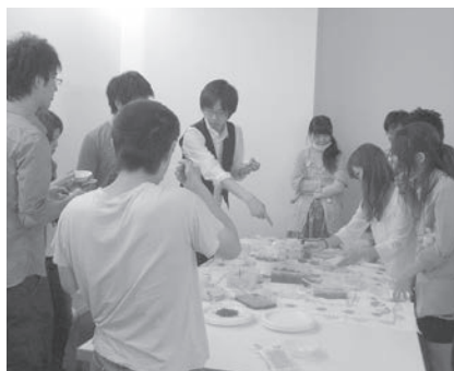
試食が進むにつれて学生の動きも活発になる