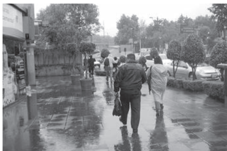
大雨の中を傘なしで歩く通勤者

2年間にわたって設計施工計画を指導し、現在なお工事進行中である。また、メキシコは途上国として支援を受ける立場ではなく、近隣の諸国へ技術援助をする側に立って将来活動することが期待されている。