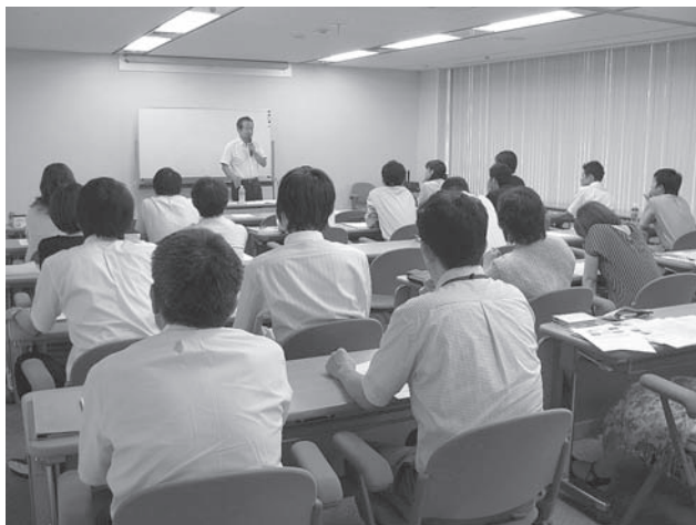
クレア内の職員向け研修風景

私がクレア勤務中に知り合った多くの自治体の職員が、クレアを通して身に付けた国際的視野を武器に、それぞれの出身母体で、国際化推進の担い手になることを祈願している。