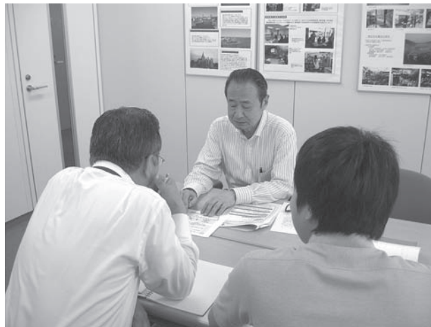
アドバイスの風景