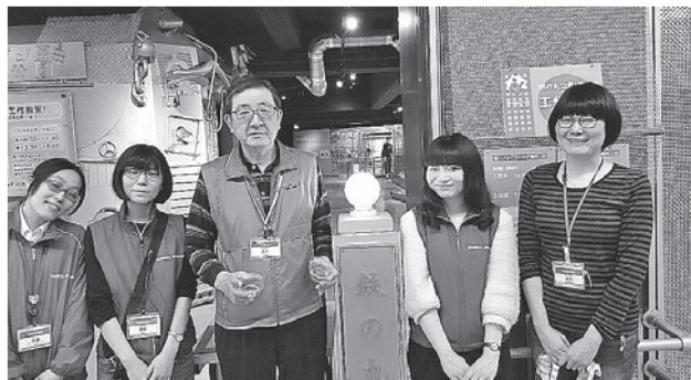
理系女スタッフと（中央が筆者）

の科学を披露する施設は多いが、加えて物づくりを体験できるという意味で大変人気の高い工作教室であった。