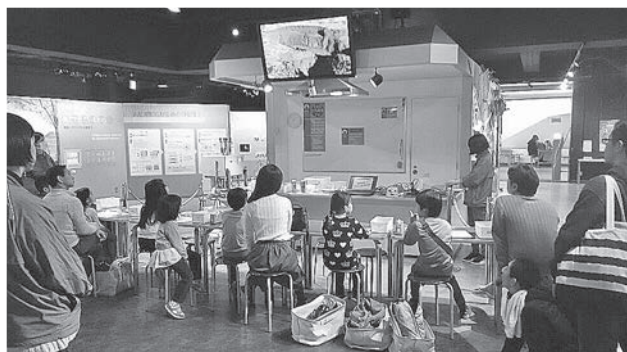
工作教室の風景と作品

工作に入るが、午前5人、午後5人と参加人数が限られているため、いつも開館直後に定員一杯となる。他の科学館でも先端