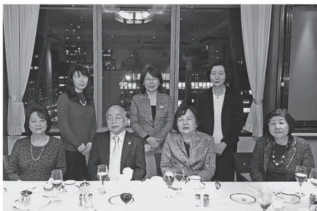
「日本の伝統的な食文化を英語で紹介する学術書」の出版記念パーティーで、大学の先生方と一緒に、黒一点？（前列左から2人目が筆者）

高知県の企業が大きく伸びるために、全国的な販路開拓や、海外企業との取引など、外の世界との積極的な交易が課題になる。「事業戦略」にこのような視点を取り入れ、大手企業とのマッチングなどこれからも積極的に推進していくつもりである。県の企業がニッチ市場でもグローバルに認知され、若者から選ばれる企業になれるよう、微力ながらこれからもお手伝いさせていただきたい。